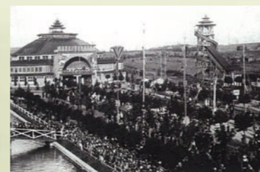
Eden - vršovický ráj nabízel nepřeberné množství zábavy

V roce 1935 byla konečně zavedena tramvajová doprava až do Strašnic, čímž se zlepšila dostupnost zdejšího parku. Část svých pozemků na trať věnoval hrabě Colloredo-Mansfeld a na nich stála také většina zábavního centra, ale po deseti letech už nechtěl dál prodlužovat majitelům atrakcí nájemní smlouvu. Osud parku v Edenu byl pomalu zpečetěn.