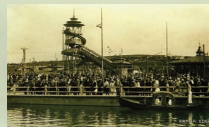
Zájem o svezení na loďce po zdejší jezírce byl vskutku nesmírný

vlastně nejistý. Už v roce 1926 se o Edenu psalo, že jeho špatnou prosperitu je třeba přičíst mimo jiné i tomu, že „v tu stranu Pražáci netáhnou“. Naopak tyto končiny lákaly četné kapsáře, pro něž byly vskutku „rájem“, nehledě na to, že pochybné existence hledaly útočiště v nouzových koloniích pod Bohdalcem. Eden se postupně stával z velkolepého kulturně-společenského centra místem neblaze proslulým.